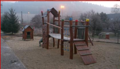
Nové multifunkční hřiště