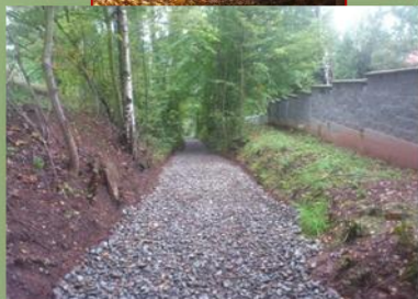
Staronová cesta kolem hřbitova.